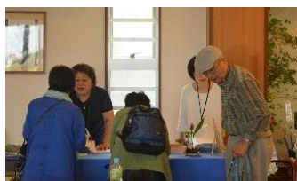
全国から、お出掛けいただきました。