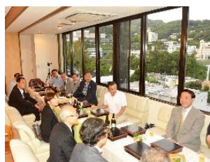
和気あいあい、手作りのお食事会を楽しんでいただきました。